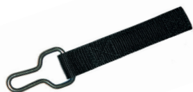
Anneaux de fixation inox (sangle noire)