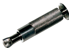
Piton douille inox Alu