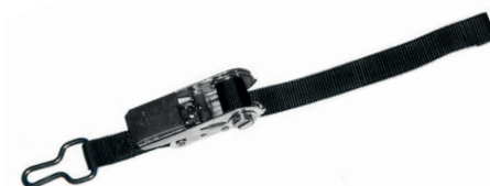
Cliquet (sangle noire)