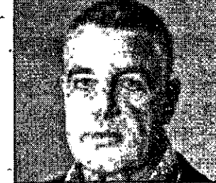
ליגד רוטלוי